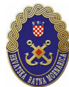
Hrvatska ratna mornarica