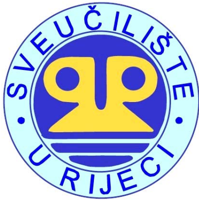
Sveučilište u Rijeci