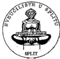
Sveučilište u Splitu Pomorski fakultet u Splitu