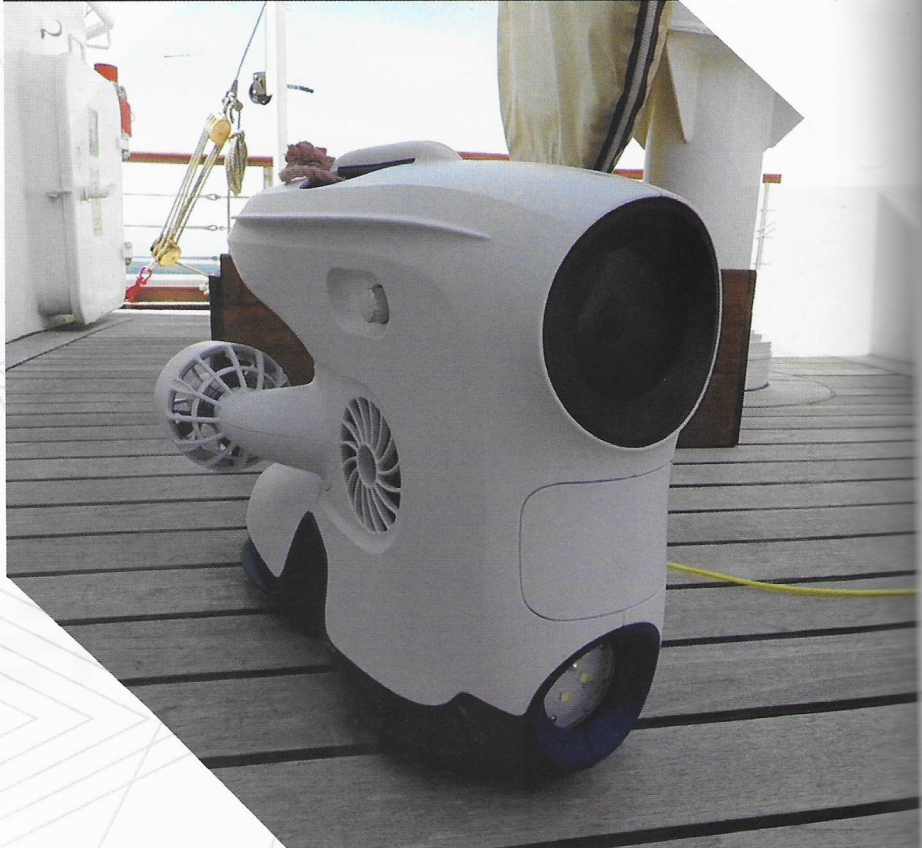
▲ Inspekcijske ronilice danas se često nazivaju i podvodnim dronovima

inspekcijske klase. Taj program je prvi te vrste u Republici Hrvatskoj, a cilj mu je pružiti osnovna teoretska znanja i praktične vještine osobama za uspješno i sigurno upravljanje ovom vrstom ROV-a.